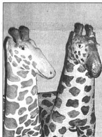
Diese niedlichen Giraffen dienen als Möbel für Kinder.